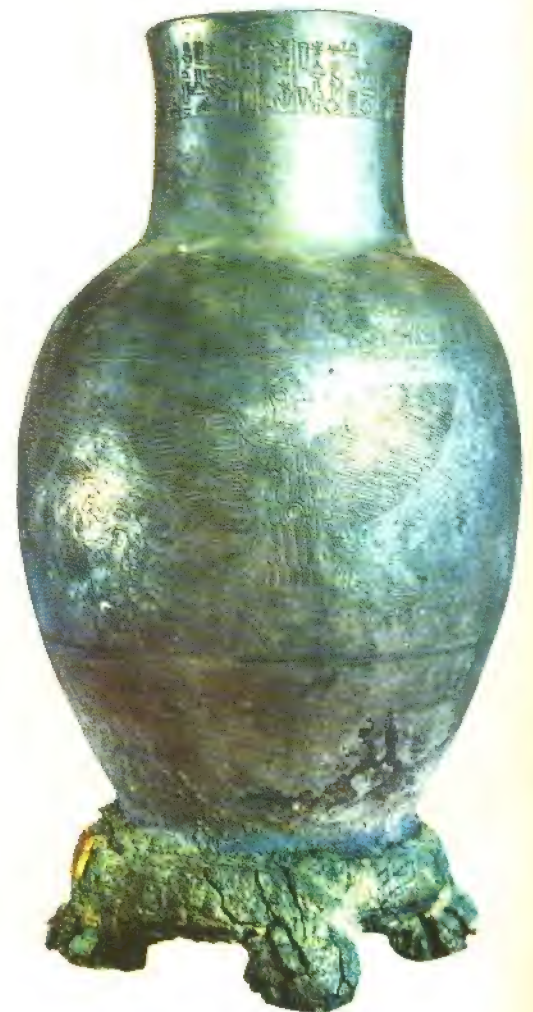
Vaso de plata montado sobre un pie de cobre del rey Entemena de Lagash correspondiente a la primera mitad del III milenio a. de J. C. (Museo del Louvre, París). El grabado representa a un dios con cuerpo de águila y cabeza de león que lleva dos presas con sus garras.

Uno de los príncipes pide a su dios que le proporcione soldados "abundantes como la hierba". Las campañas se resolverían con la anexión de los territorios vecinos, que debió de ser efímera, pues no se llegó a establecer un imperio sumerio. Pero las anexiones, aunque fueran temporales, prepararon el advenimiento de un conquistador, que fue ya semita, que reuniría bajo su dominio todas las ciudades mesopotámicas. Algunos de los esfuerzos de conquista de los sumerios son tan importantes, que fijan fechas de la cronología; pero quedan grandes lagunas en las series de los monarcas y para ciertos reinados vacilantes entre dos dinastías, separadas a veces por más de mil años. De todos modos, a pesar de esta incertidumbre y de lo caótico del material, tenemos positiva información histórica sobre personajes sumerios desde el año 4000 a. de J. C. por lo menos. Y por lo que sabemos de ellos, comprendemos que les faltó a los príncipes patriarcas de la Baja Caldea la tenacidad y, sobre todo, la crueldad, que harán triunfar más tarde a los semitas. Son más bien sacerdotes que monarcas, hablan siempre en nombre de su dios, y por él gobiernan el estado. Es evidente que los primitivos prin-